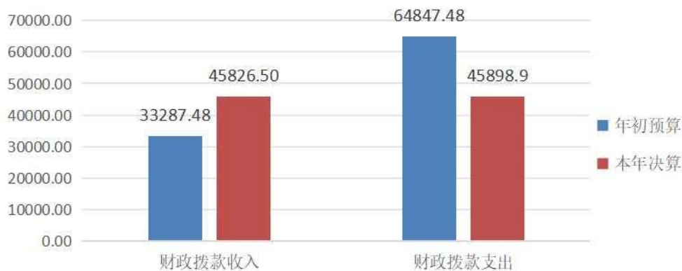
图4：财政拨款收支预决算对比图

发展，项目增加；支出完成年初预算 34.82%，比年初预算增加减少 21137.47 万元，主要是调整上年结转结余，支出减少。